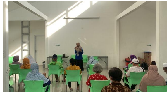
Gambar 3. Antusiasme peserta Prolanis dalam mengikuti kegiatan simulasi komunikasi efektif

Kadar glukosa yang menumpuk didalam darah dapat mengganggu organ tubuh lain, menyebabkan gangguan komplikasi hingga menyebabkan kematian pada penderitanya (Ekawita et al., 2020). Penderita diabetes di Indonesia setiap tahunnya meningkat. WHO memperkirakan jumlah penderita diabetes khususnya tipe 2 akan meningkat signifikan hingga 16,7 juta pada tahun 2045. Jika masyarakat Indonesia tidak sadar akan penyakit ini dan kerap menyepelekan.