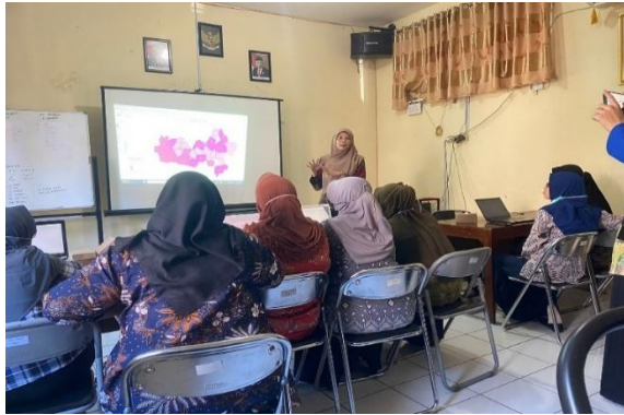
Gambar 4. Pemberian pelatihan SIG pada Tenaga Kesehatan

SIG merupakan sistem kompleks yang biasanya terintegrasi dengan lingkungan sistem-sistem komputer yang lain di tingkat fungsional dan jaringan. Komponen SIG terdiri dari perangkat keras, perangkat lunak, data dan informasi geografi, serta manajemen (Wibowo et al., 2015).