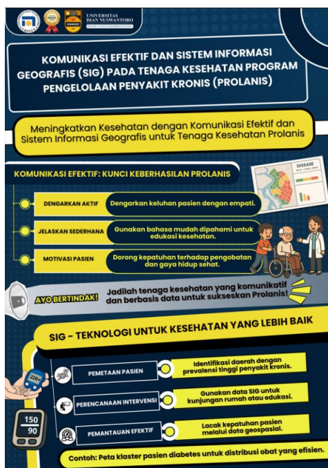
Gambar 2. Media Edukasi materi Komunikasi Efektif Pada Tenaga Kesehatan

Diabetes adalah suatu penyakit yang ditandai dengan meningkatnya kadar gula darah dalam tubuh dengan kisaran diatas normal yang diakibatkan kegagalan pankreas memproduksi insulin yang mencukupi atau tubuh yang tidak dapat menggunakan insulin yang cukup baik (Pratiwi & Hufri, 2020). Sedangkan Hipertensi adalah suatu kondisi medis ketika tekanan darah di pembuluh darah secara konsisten berada di atas batas normal, yaitu \geq 140 mmHg untuk tekanan sistolik atau \geq 90 mmHg untuk tekanan diastolik, berdasarkan pengukuran berulang dalam keadaan istirahat (Iqbal & Jamal, 2023).