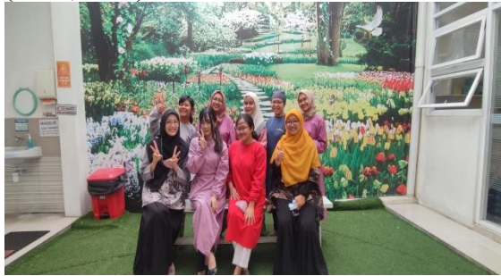
Gambar 1. Penyampaian materi Komunikasi Efektif Pada Tenaga Kesehatan

kesehatan bagi peserta BPJS Kesehatan yang menderita penyakit kronis untuk mencapai kualitas hidup yang optimal dengan biaya pelayanan kesehatan yang efektif dan efisien (BPJS, 2014).