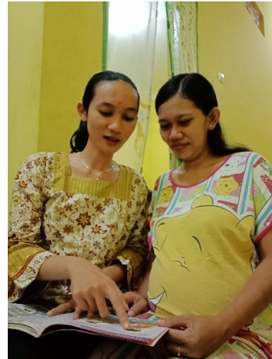
Gambar 3. Penyuluhan kepada peserta dengan bantuan buku KIA

Kegiatan diawali dengan pengenalan tim kegiatan, maksud serta tujuan kegiatan pengabdian masyarakat ini. Tim pengabdian masyarakat akan memberikan lembar persetujuan kepada peserta untuk menjadi responden kegiatan. Peserta kegiatan akan diberikan lembar pre-test yang berisi 10 poin pertanyaan dan diarahkan saat pengisiannya. Selanjutnya, tim pengabdian masyarakat memberikan penyuluhan kepada ibu hamil dengan materi kesehatan ibu dan anak. Instrumen yang digunakan untuk penyuluhan adalah buku KIA yang selalu dimiliki oleh ibu hamil. Saat penyuluhan, tim juga menanyakan terkait keluhan yang dialami ibu dan memberikan Pendidikan Kesehatan terkait keluhan tersebut. Ibu hamil yang sudah memasuki trimester 3 akan mendapat penyuluhan terkait ASI eksklusif dan perawatan bayi baru lahir. Tim kegiatan ini memberikan penyuluhan dengan memperhatikan usia kehamilan, kondisi dan keluhan ibu hamil sebagai peserta kegiatan.