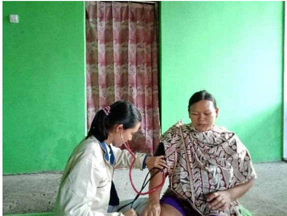
Gambar 2. Pemeriksaan tekanan darah sebagai langkah awal kegiatan

penggunaan aplikasi Sayang Bunda diharapkan dapat meningkatkan sikap positif ibu (mawas diri) dan menurunkan AKI serta AKB. Kegiatan dilakukan dengan mendatangi rumah masing-masing ibu hamil dengan bantuan kader posyandu setempat. Peserta kegiatan sebanyak 10 ibu hamil baik yang sedang hamil trimester 1, 2 atau 3.